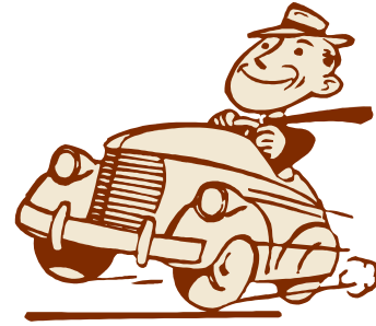
Ông ta lái xe rất cẩn thận .