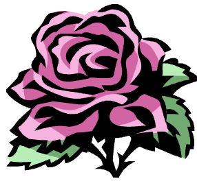
Hoa hồng đỏ .