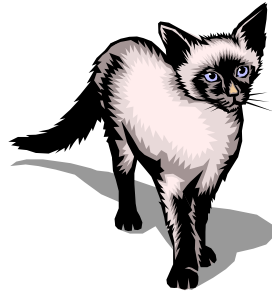
Con mèo xám .